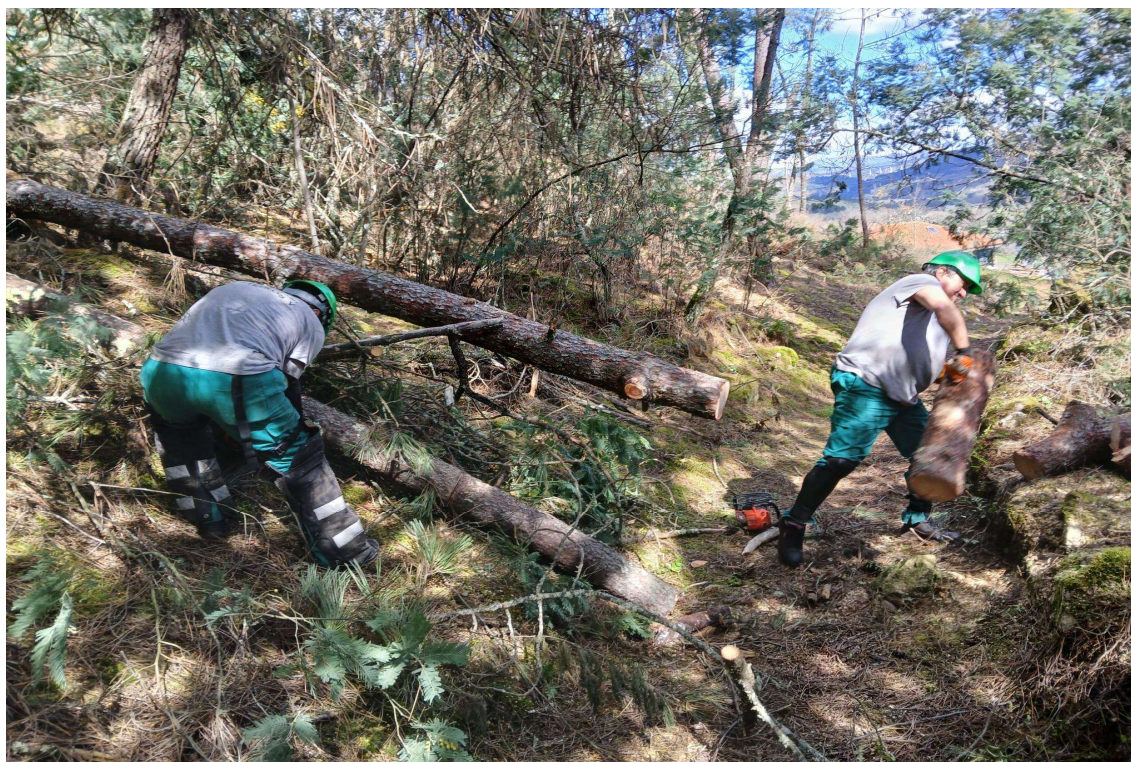
Figura nº2. Recuperación de caminos abandonados. Concello de O Irixo (Ourense). Autor: Arrieiros V.