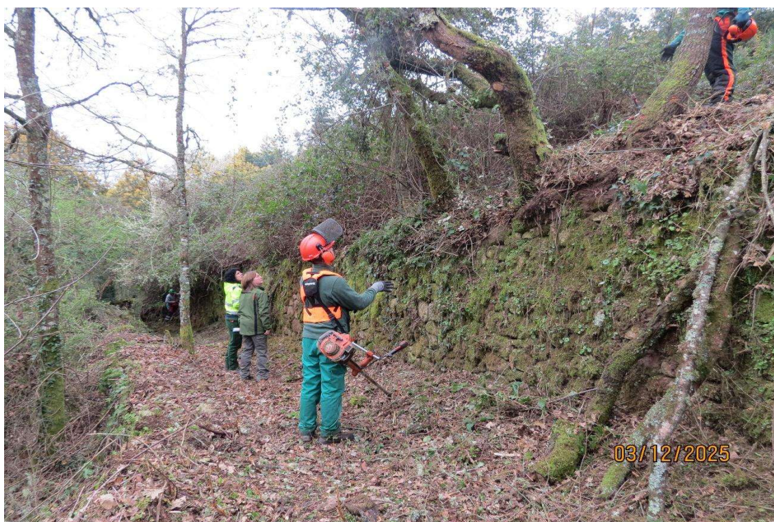
Figura nº 1. Formación del taller de empleo ARRIEIRO V. Concello de O Irixo (Ourense).

El taller de empleo “Arrieiros V” trabaja en la recuperación de caminos rurales abandonados. Los talleres de empleo son programas de formación subvencionados por la Xunta de Galicia en los que se busca formar a personales del rural en el sector forestal, para garantizar la continuidad de mano de obra en el sector.