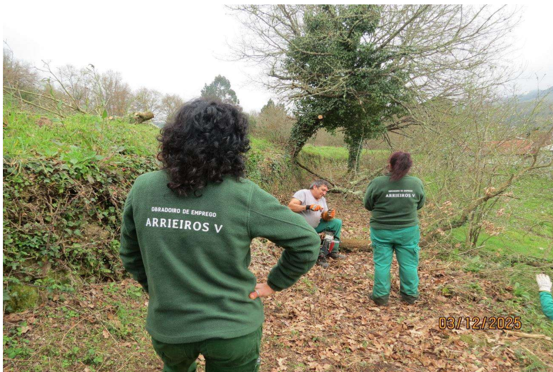
Figura nº 3. Formación del taller de empleo ARRIEIROS V. Concello de O Irixo (Ourense). Autor: REMP

De este modo, se logra un doble impacto: la formación cualificada del alumnado y la mejora de infraestructuras comunitarias que fortalecen la cohesión social y territorial.