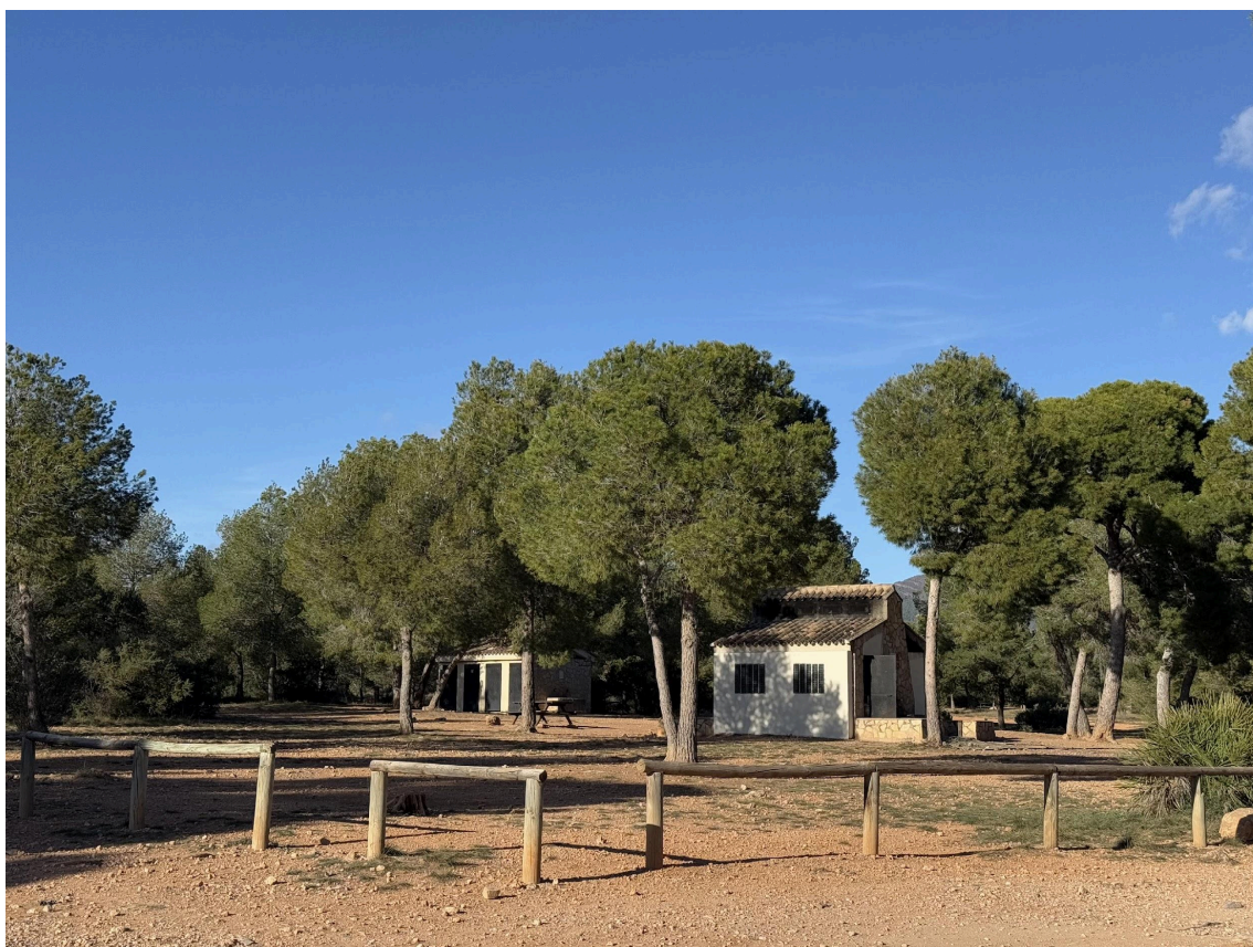
Figura nº1: Zona de acampada situada dentro del Parque Natural de la Serra Calderona, con capacidad para 150 plazas (Comunitat Valenciana). Año: enero 2025.

El Portal de Reservas de Acampada nace de la necesidad de unificar y simplificar el modelo y la metodología de reservas para utilizar las instalaciones recreativas y zonas de acampada promovidas y mantenidas por la Generalitat Valenciana dentro de la comunidad autónoma.