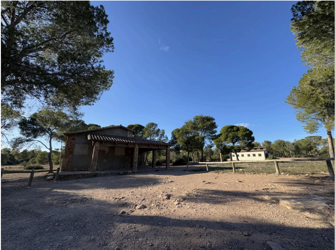
Figura nº4: Zona de acampada situada dentro del Parque Natural de la Serra Calderona, Portacoeli (Comunitat Valenciana). Año: enero 2025.